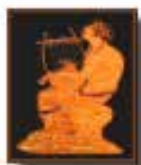
ORPHEUS Award 2019