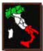
ITALIA Award 2019