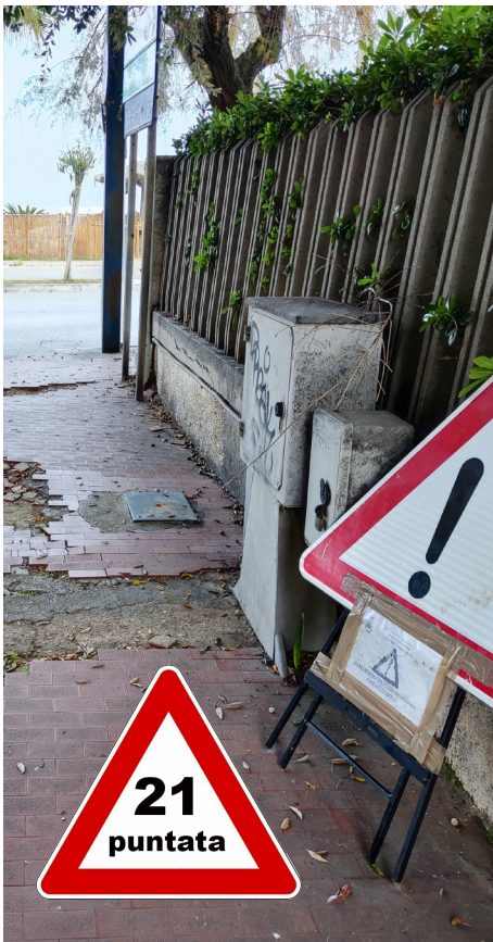
immagine del 3 dicembre 2024

20 luglio 2024 - 29 dicembre 2024 162 giorni (23 settimane)