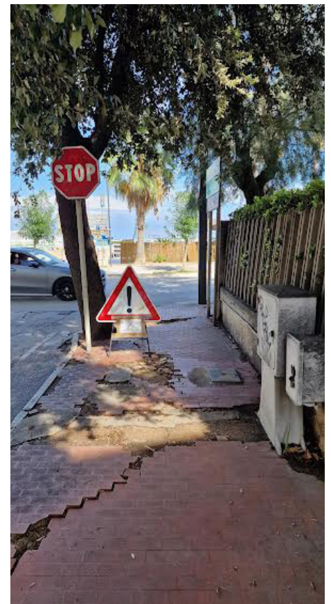
immagine del 15 settembre 2024

dal 24 luglio 2024 24 settimana - 1 gennaio 2025