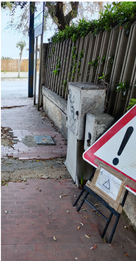
immagine del 3 dicembre 2024

Lo stesso tratto negli anni è stato rappezzato con pezzi di cemento.