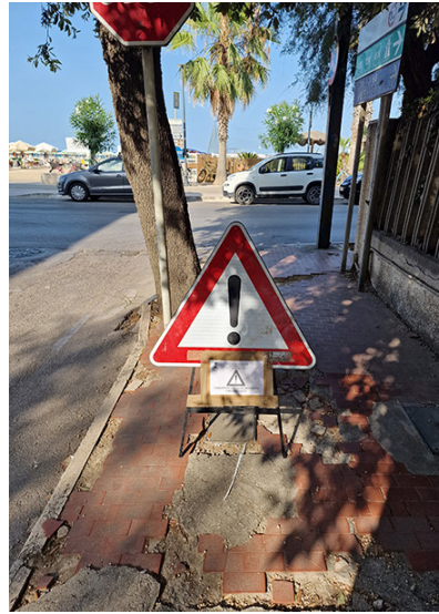
immagine del 20 luglio 2024