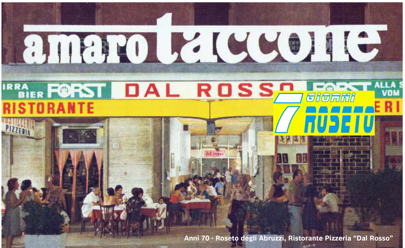
Anni 70 - Roseto degli Abruzzi, Ristorante Pizzeria "Dal Rosso"