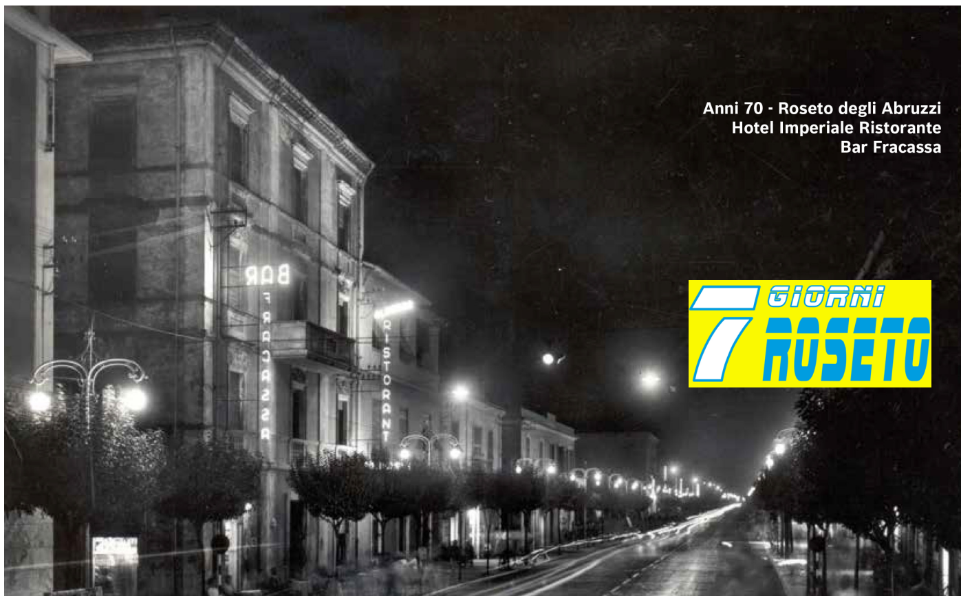
Anni 70 - Roseto degli Abruzzi Hotel Imperiale Ristorante Bar Fracassa