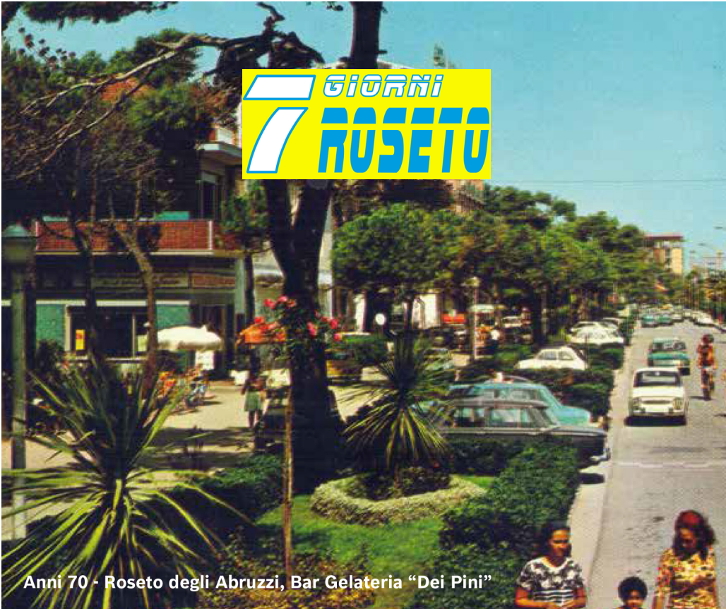
Anni 70 - Roseto degli Abruzzi, Bar Gelateria "Dei Pini"