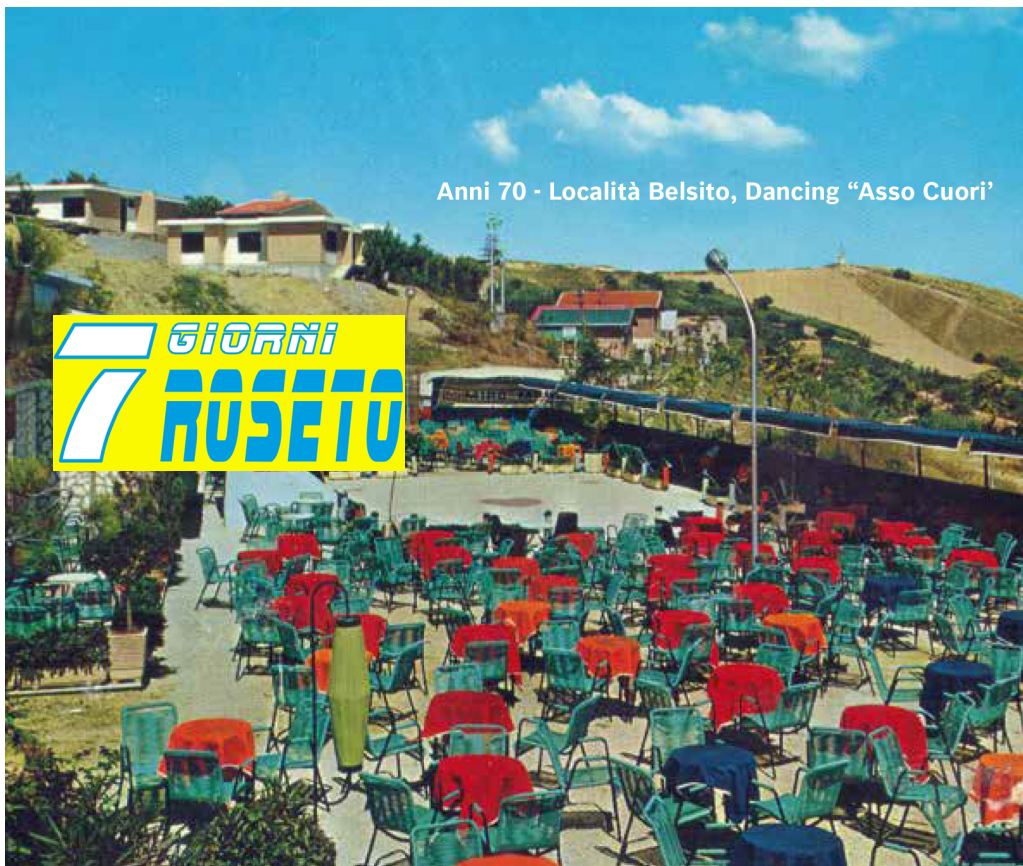
Anni 70 - Località Belsito, Dancing "Asso Cuori"