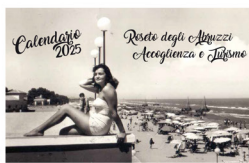
Roseto degli Abruzzi - Accoglienza e Turismo