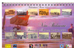
Roseto degli Abruzzi - Vita Balneare