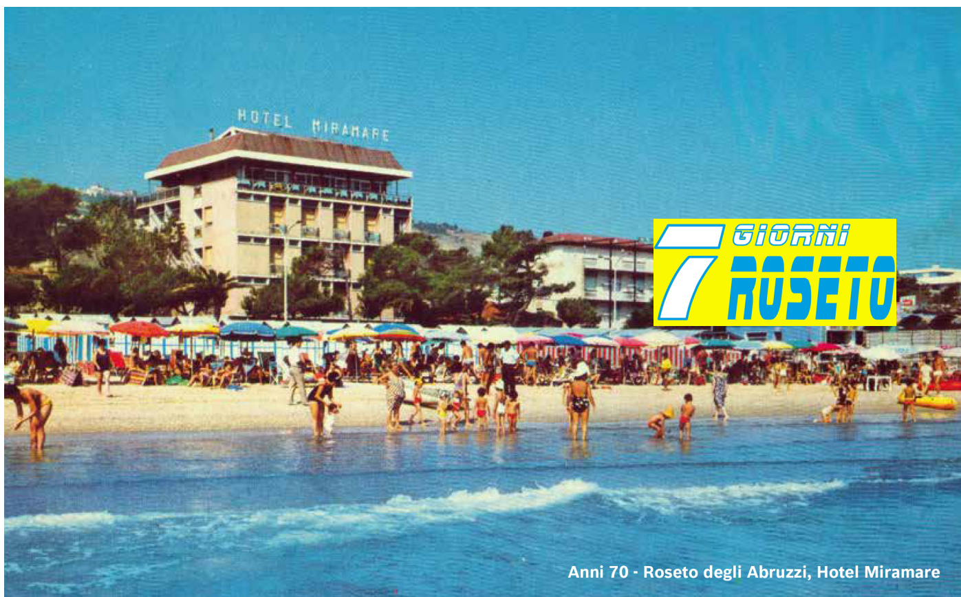
Anni 70 - Roseto degli Abruzzi, Hotel Miramare