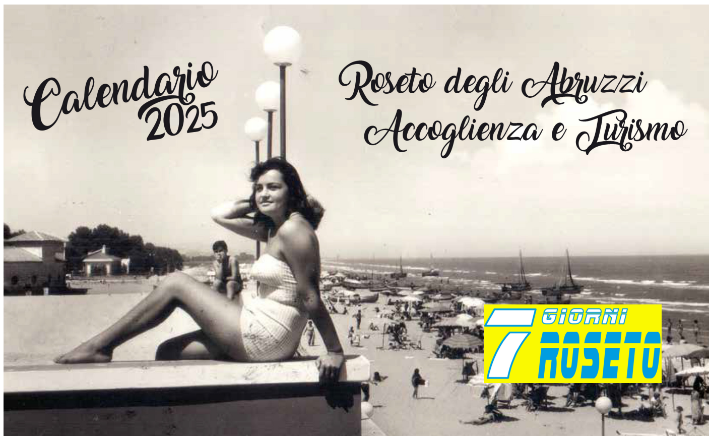
anni '60 - pescheria al mare - lido la lucciola