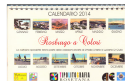
Rosburgo a colori