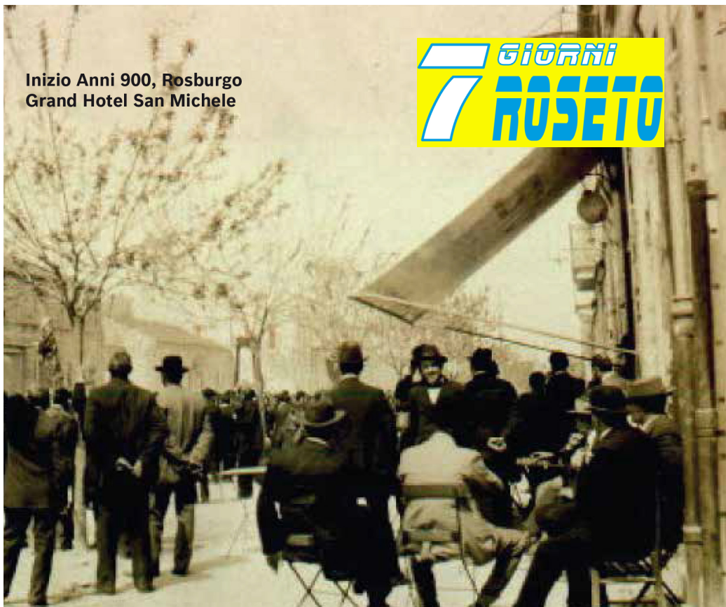
Inizio Anni 900, Rosburgo Grand Hotel San Michele