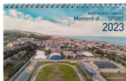
Roseto degli Abruzzi - Momenti di ... Sport