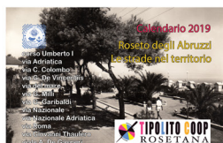
Roseto degli Abruzzi - Le strade del territorio