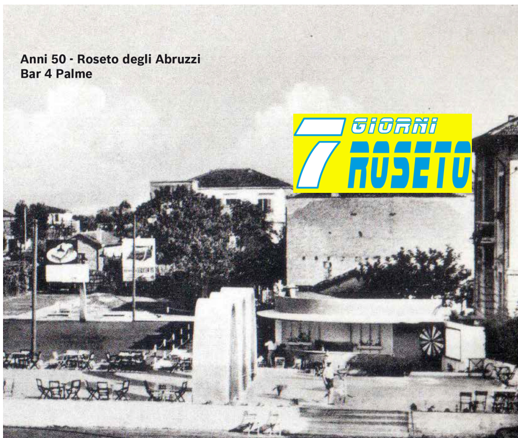
Anni 50 - Roseto degli Abruzzi Bar 4 Palme