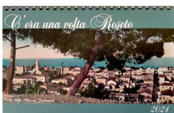
C'era una volta Roseto