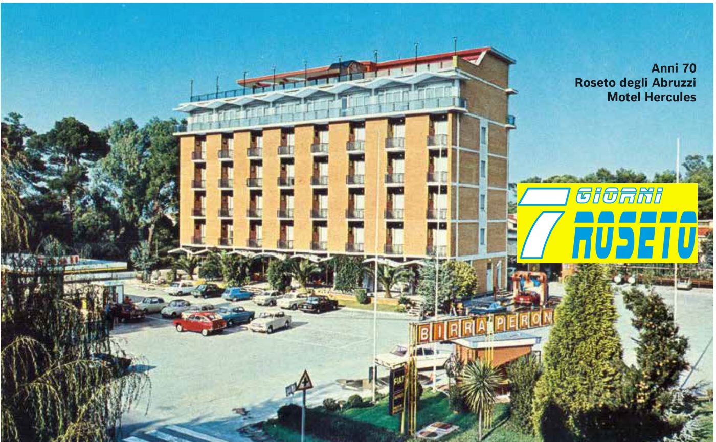
Anni 70 Roseto degli Abruzzi Motel Hercules