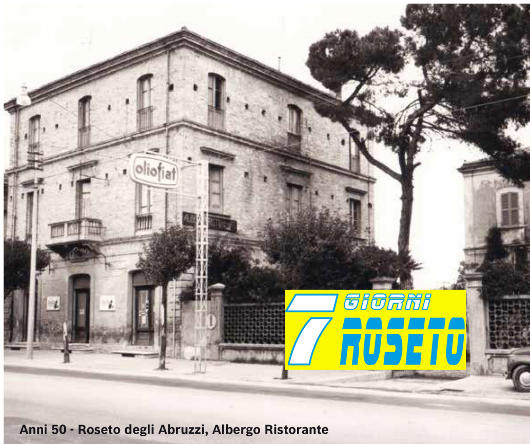
Anni 50 - Roseto degli Abruzzi, Albergo Ristorante