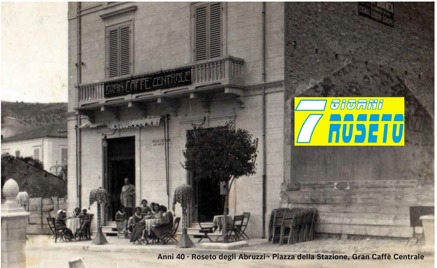
Anni 40 - Roseto degli Abruzzi - Piazza della Stazione, Gran Caffè Centrale