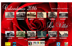
Roseto degli Abruzzi - Le Ville