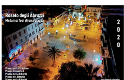
Roseto degli Abruzzi - Metamorfosi di una piazza