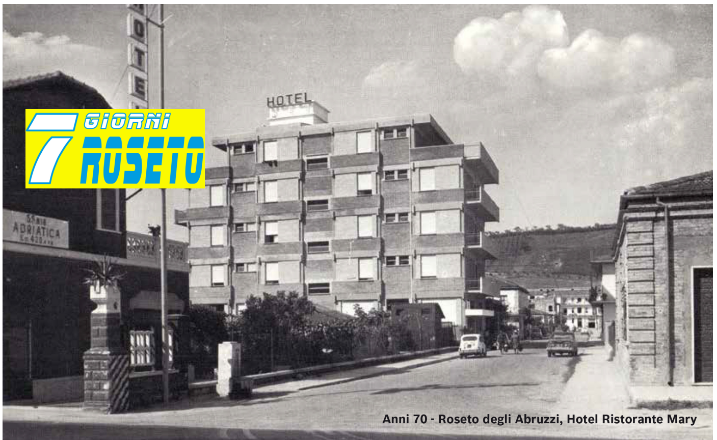
Anni 70 - Roseto degli Abruzzi, Hotel Ristorante Mary