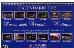
Roseto degli Abruzzi - Notturna