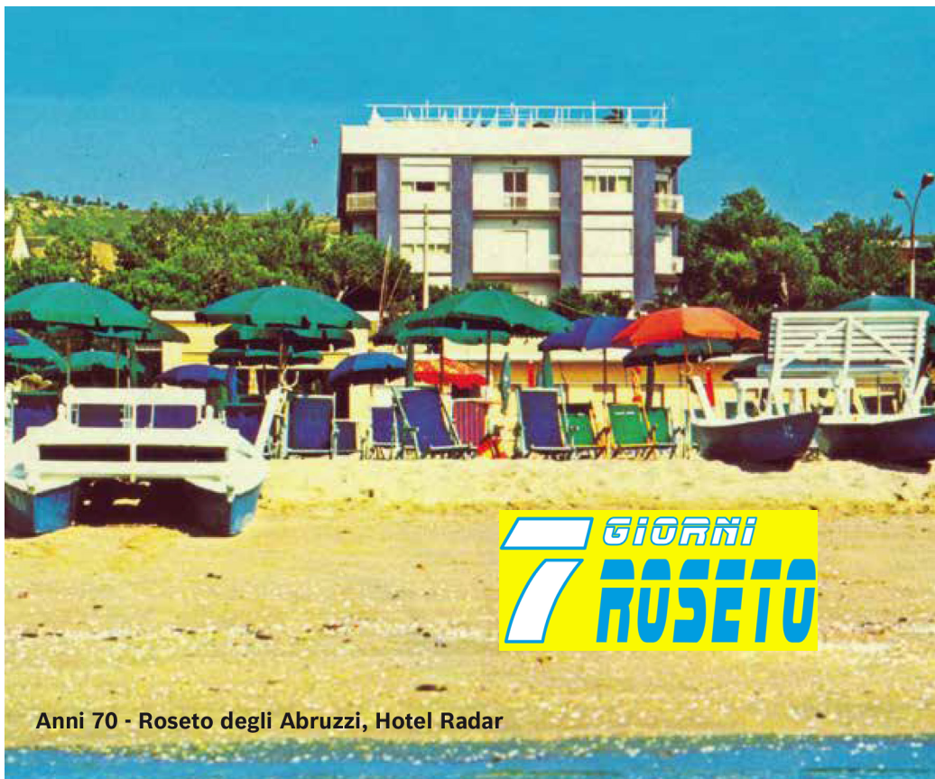
Anni 70 - Roseto degli Abruzzi, Hotel Radar