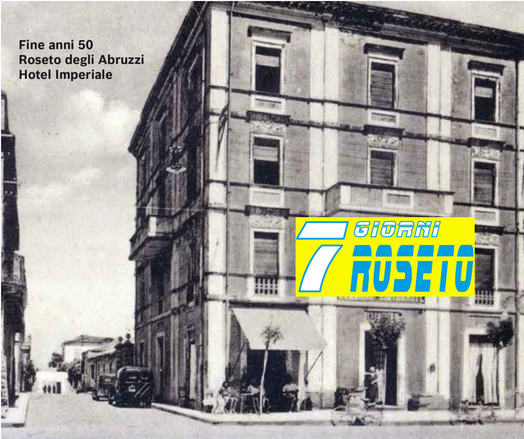
Fine anni 50 Roseto degli Abruzzi Hotel Imperiale