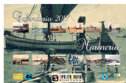
Roseto degli Abruzzi - Marineria