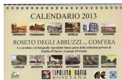
Roseto degli Abruzzi - com'era