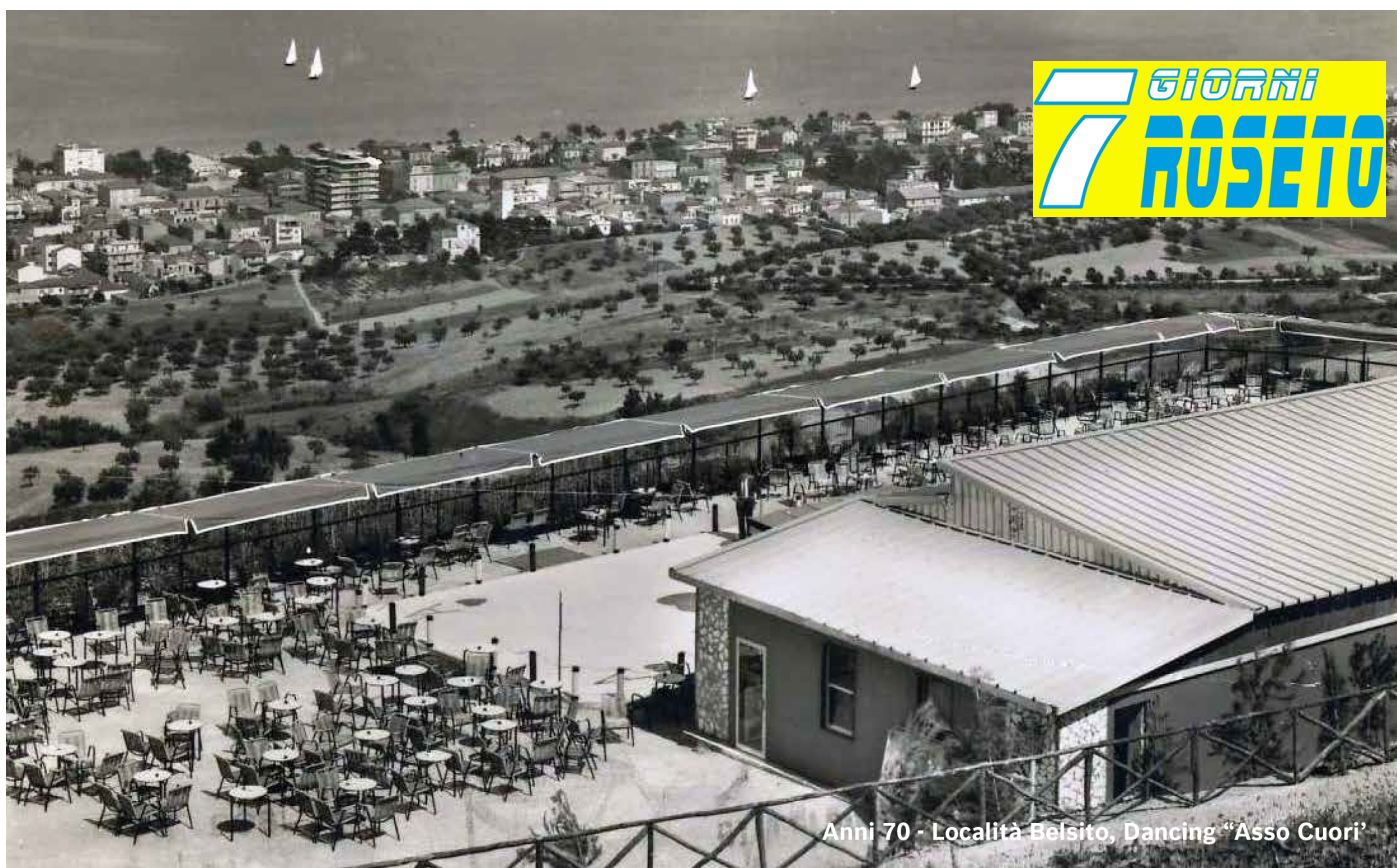
Anni 70 - Località Belsito, Dancing "Asso Cuori"