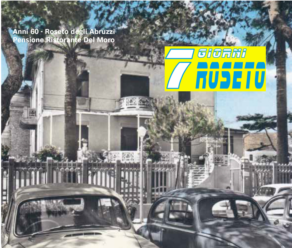
Anni 60 - Roseto degli Abruzzi Pensione Ristorante Del Moro