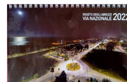
Roseto degli Abruzzi - Via Nazionale