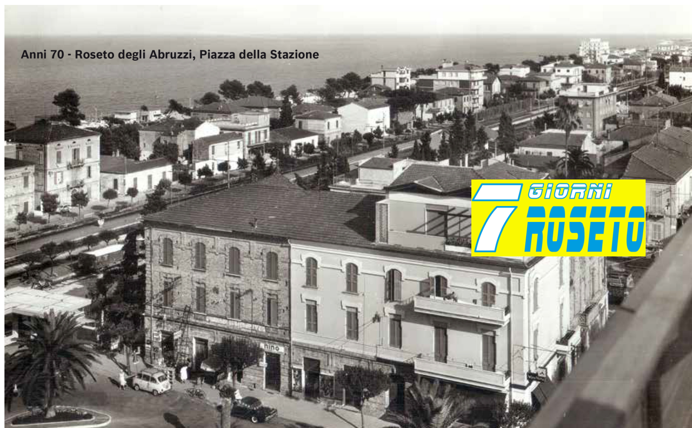
anni ' 70 - piazza della stazione - bar centrale