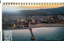
Roseto degli Abruzzi - Vista dal mare