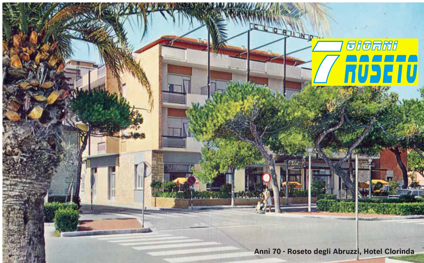
Anni 70 - Roseto degli Abruzzi, Hotel Clorinda