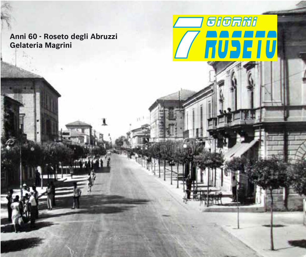
Anni 60 - Roseto degli Abruzzi Gelateria Magrini