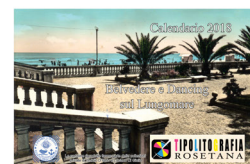
Belvedere e Dancing sul Lungomare