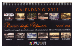
Roseto degli Abruzzi - com'era