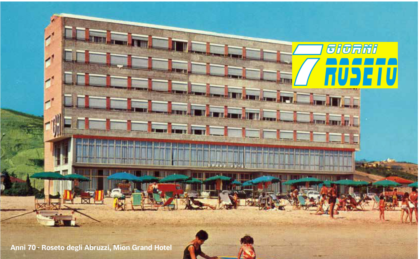
Anni 70 - Roseto degli Abruzzi, Mion Grand Hotel